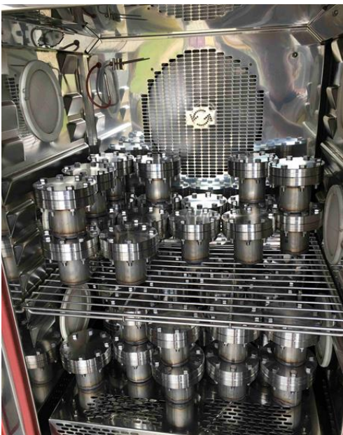
Abbildung 3: Umweltsimulation in der Klimakammer: die Treibladungspresslinge befinden sich in metallisch dichten Gefäßen mit vordefiniertem Feuchteniveau.

Die Studie wurde durch Untersuchungen an Airbag-Gasgeneratoren aus dem Feld ergänzt und erlaubte so den Abgleich zwischen Labor- und Feldbedingungen.